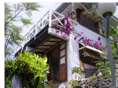
O quarto de hóspede

Terraço, varandim, barbecue, mesa(s) de jardim, cadeira(s) de jardim