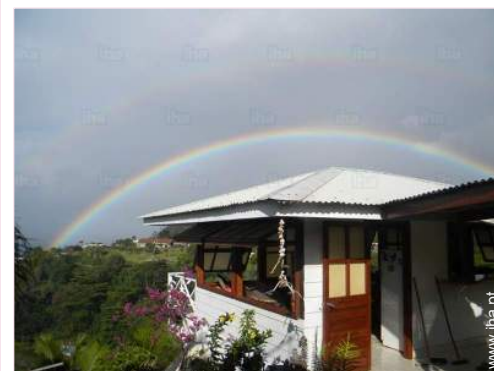
vista a partir da casa