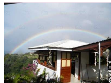
vista a partir do varandim