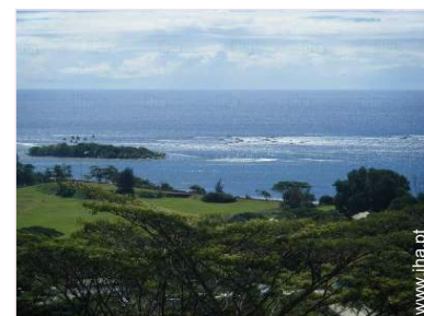
vista a partir da cozinha