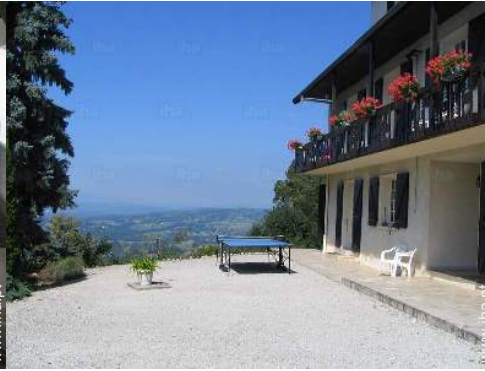
vista a partir do apartamento