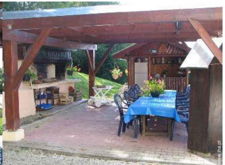
visão de conjunto