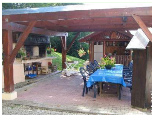
visão de conjunto