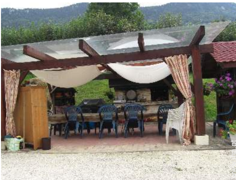
vista a partir do apartamento