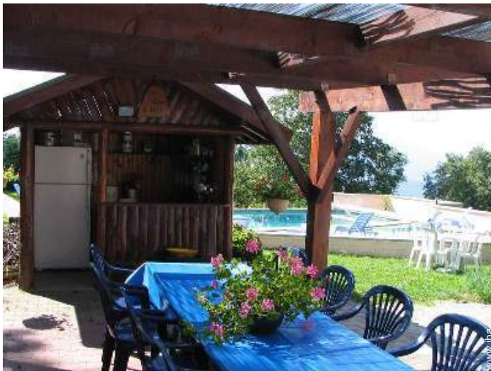
infraestruturas de lazer