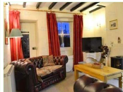
sala de estar