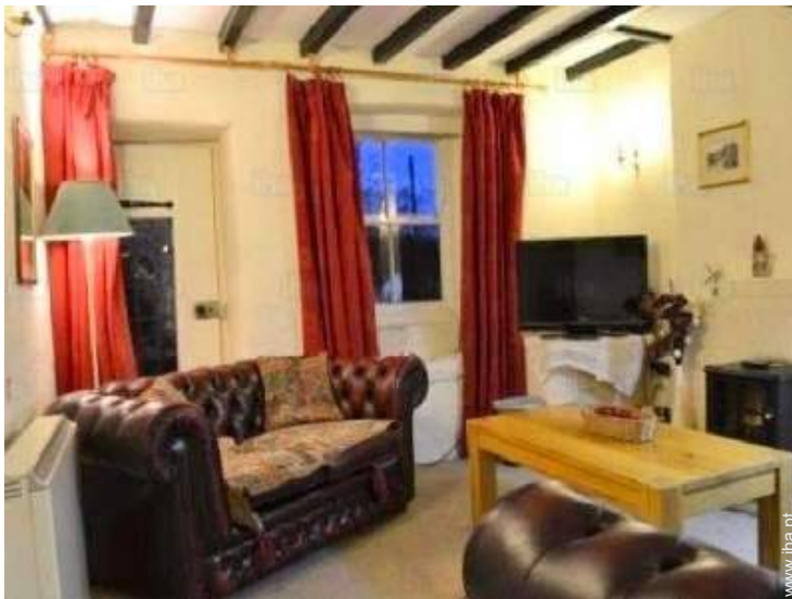
sala de estar