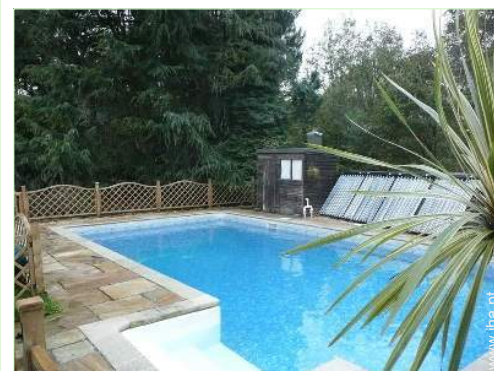
vista sobre piscina