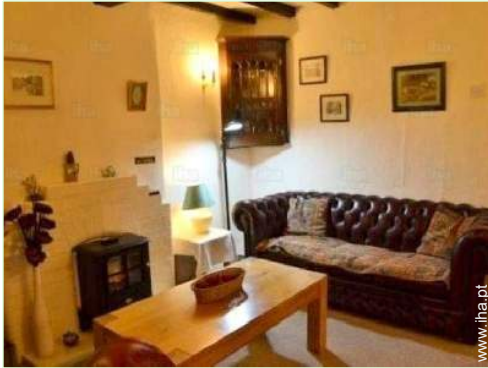
quarto de serviço