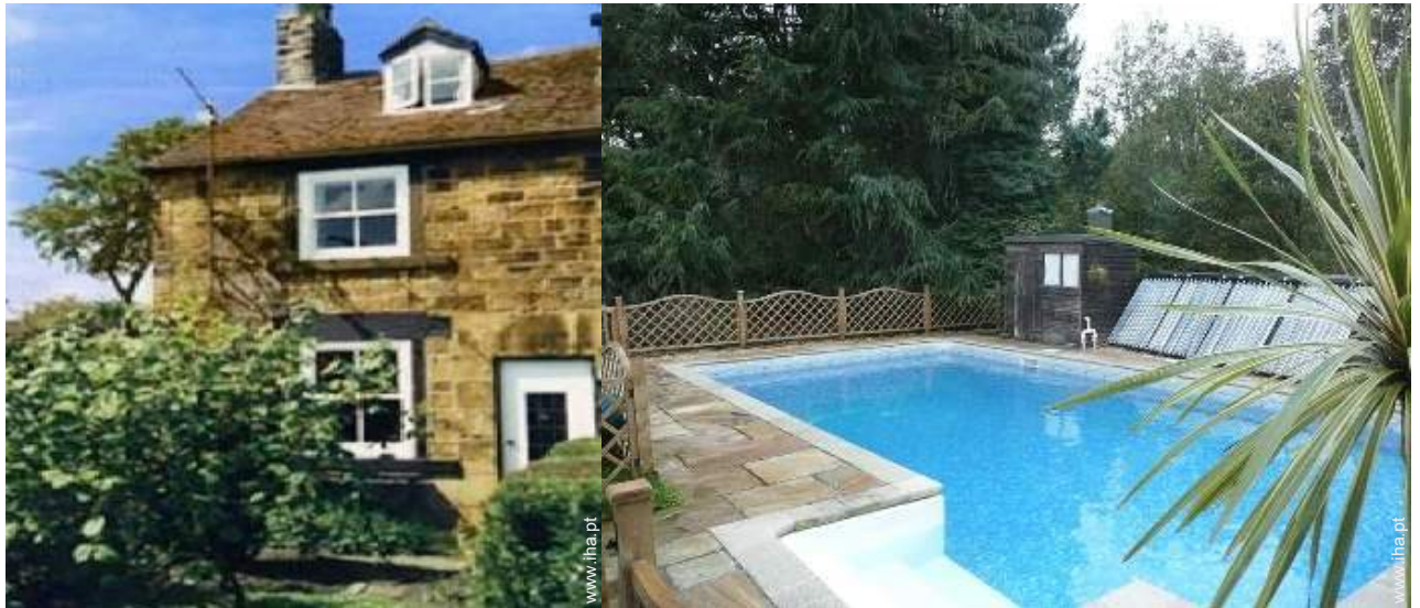
vista sobre piscina