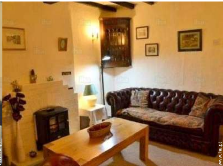
quarto de serviço