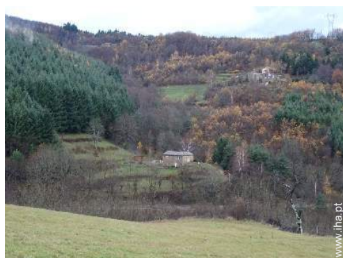
vista a partir da casa