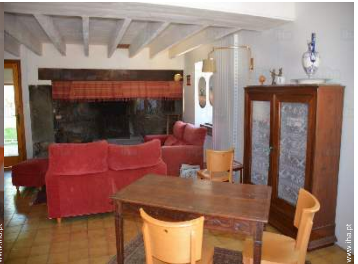
sala de estar