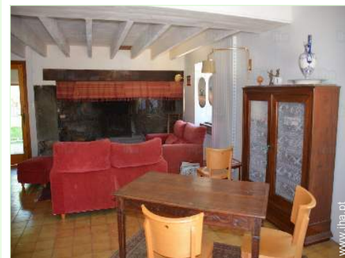
sala de estar