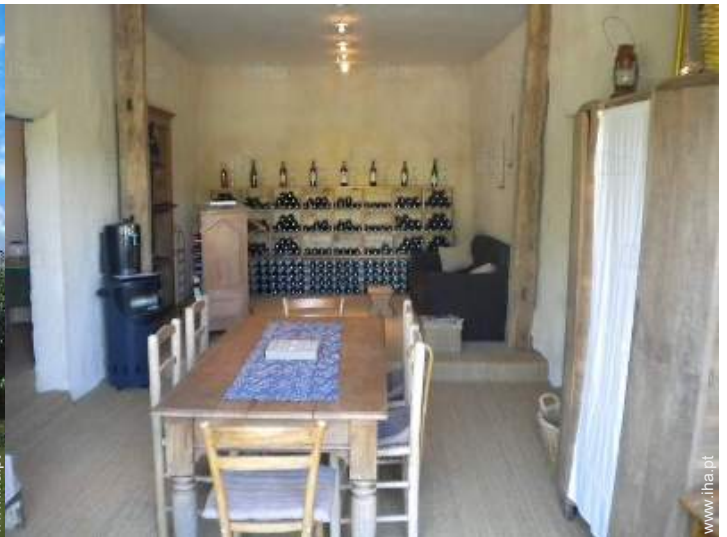
sala de jantar