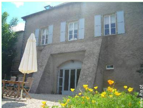
vista a partir do jardim/parque