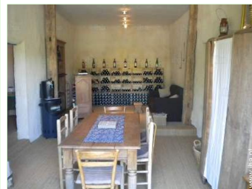
sala de jantar

• Lugar pitoresco : Piscina pública 5km Corte de ténis público 5km Campo de golfe 9 buracos 20km Rio 20km