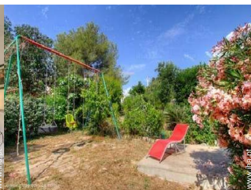
Equipamentos de lazer