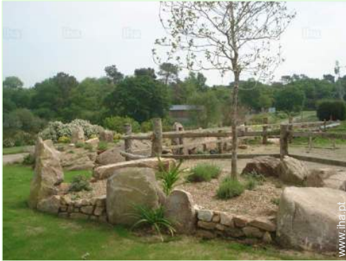
vista a partir do jardim/parque