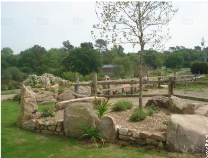
vista a partir do jardim/parque