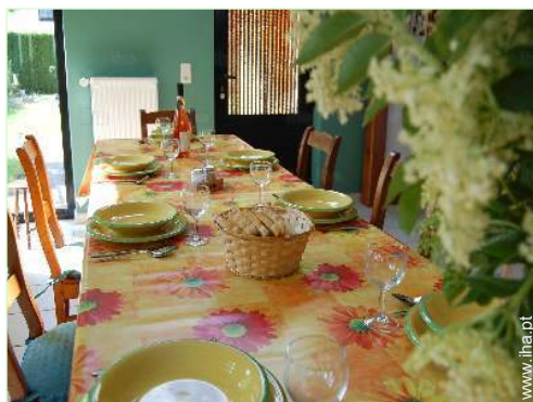
sala de jantar