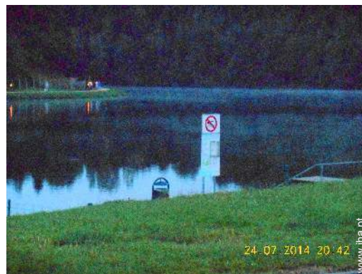
actividades balneares nas proximidades