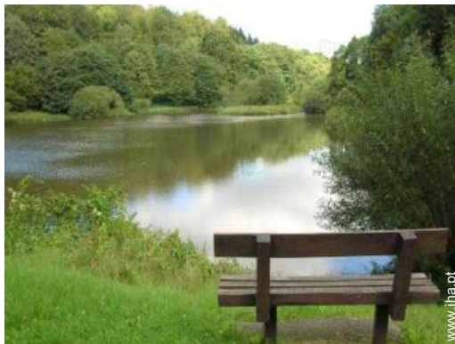
actividades nas proximidades