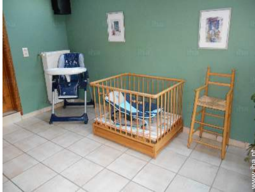
Equipamentos para bebés