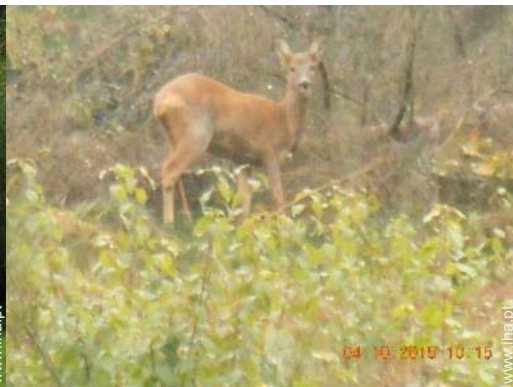
vista a partir do jardim/parque