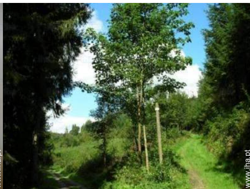
actividades nas proximidades