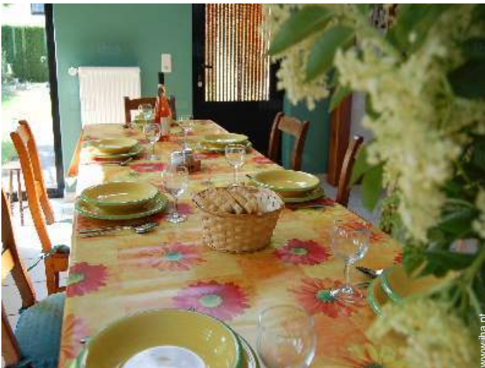
sala de jantar