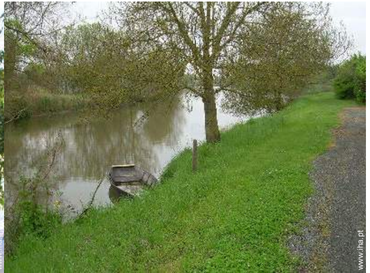
vista para rio