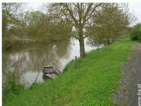
vista para rio