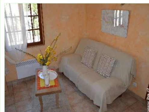
sofá(s) cama 2 pessoas

• Comodidades : Centro da cidade 3km Aluguer bicicletas/BTT 7,5km Padaria 3km Comida para fora 7,5km Pequenos comércios 3km Supermercado 7,5km Correios 3km Banco 7,5km Caixa automático multibanco 7,5km Farmácia 3km Médico 3km Enfermeira 3km Hospital 7,5km