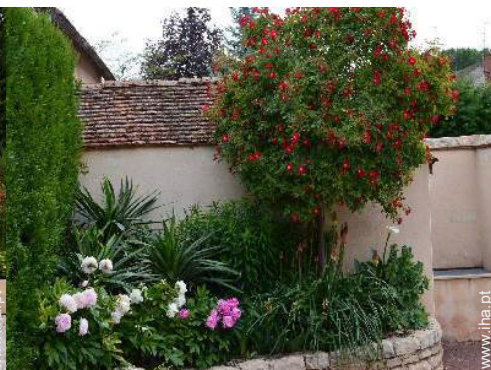
vista a partir do apartamento