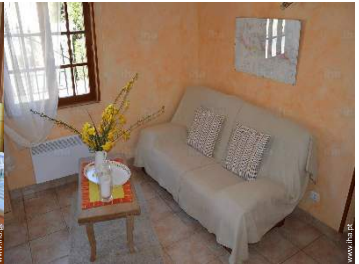
sofá(s) cama 2 pessoas