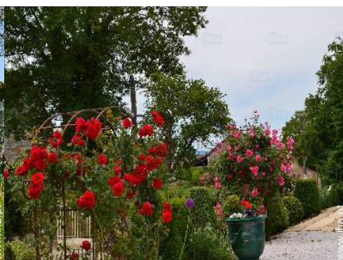
vista a partir do jardim/parque