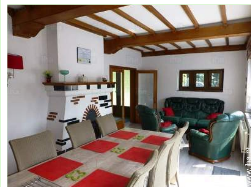
sala de jantar