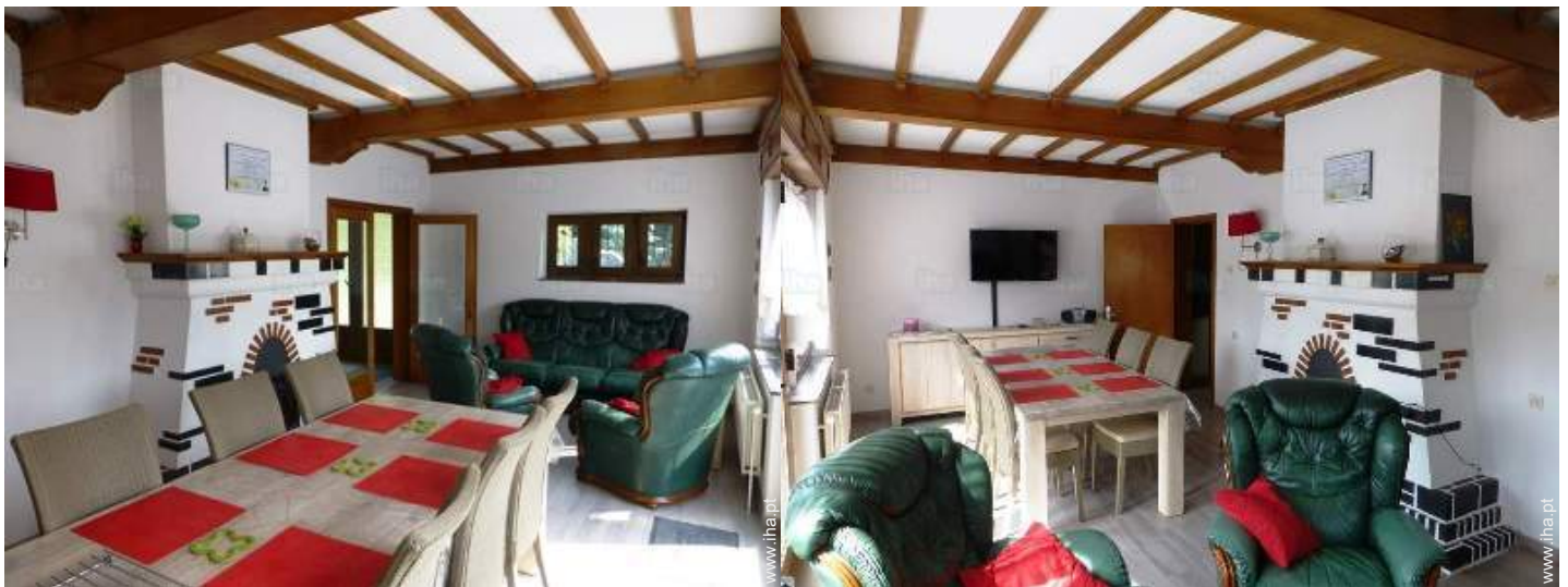
sala de jantar