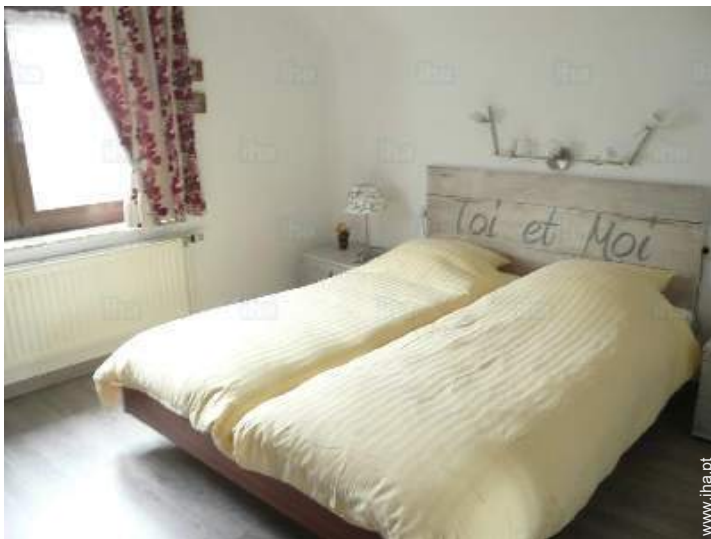
quarto de amigos