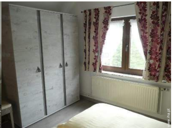
quarto de amigos