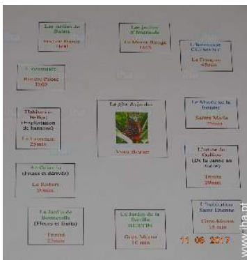
parque e jardim