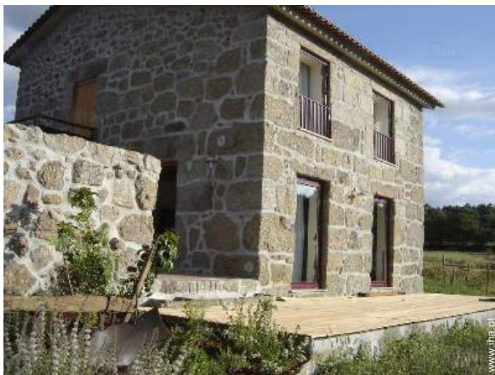
Casa de pedra