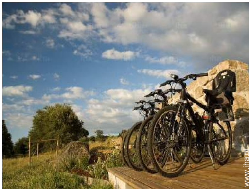
BTT (itinerário circuito)