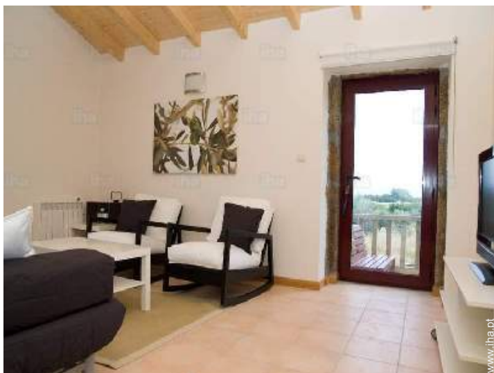
sala de estar