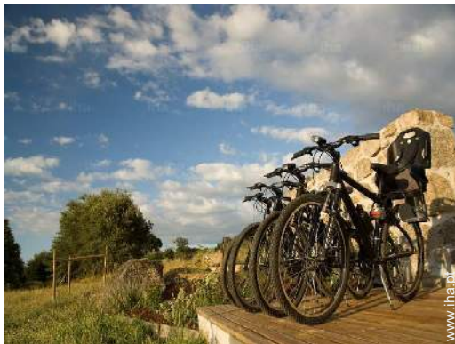
BTT (itinerário circuito)