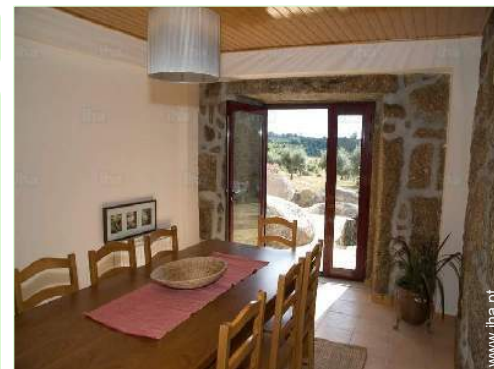
sala de jantar

Barbecue, mesa(s) de jardim, 6 cadeira(s) de jardim, guarda-sol, 2 espreguiçadeira(s)