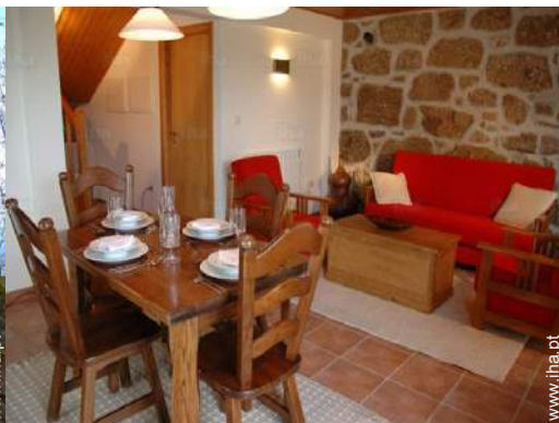
sala de estar