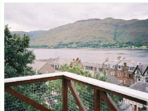
vista a partir do varandim