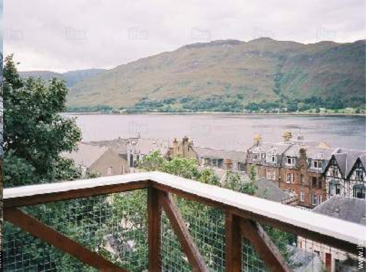
vista a partir do varandim