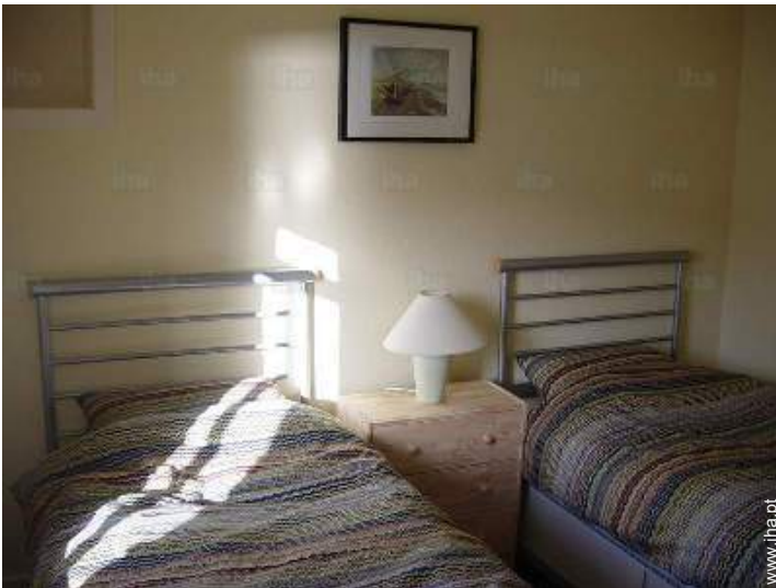
camas separadas simples