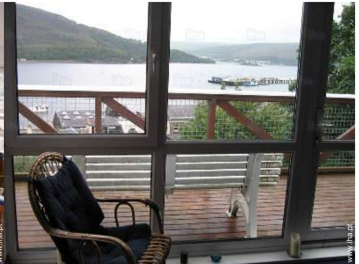
vista a partir do salão