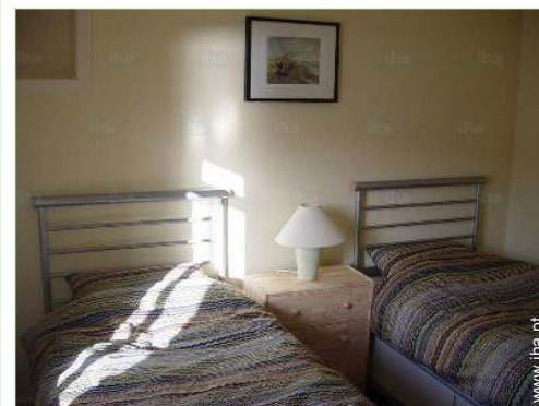
camas separadas simples

Pistas de esqui 10km Meios mecânicos 10km Mar/oceano 200m Piscina pública 1km Campo de golfe 18 buracos 2km Rápidos nos rios 1km Cascata 3km Falésia 2km Rio 1km Lago 200m Floresta 1km Maciço montanhoso 2km Porto de recreio 1km Passadiço flutuante para barco 200m Passadiço flutuante para jet-ski 200m