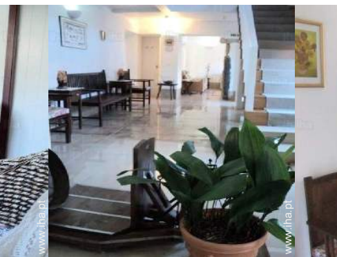
Conforto interior à disposição dos hóspedes