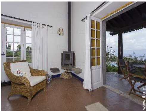
vista a partir da sala de estar