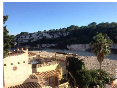
vista a partir do terraço sobre telhado

Mar/oceano <50m Praia <50m Corte de ténis público 1km Campo de golfe 9 buracos 15km Campo de golfe 18 buracos 15km Base naval 50km Spot windsurf 15km Base náutica 25km Porto de recreio 5km