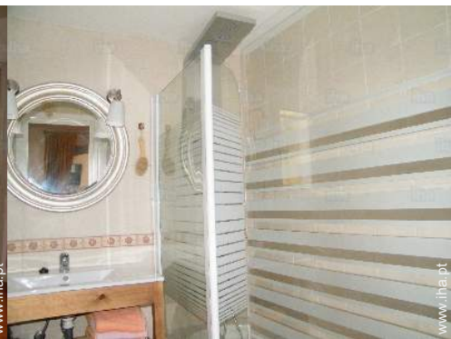
casa(s) de banho