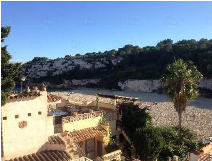
vista a partir do terraço sobre telhado