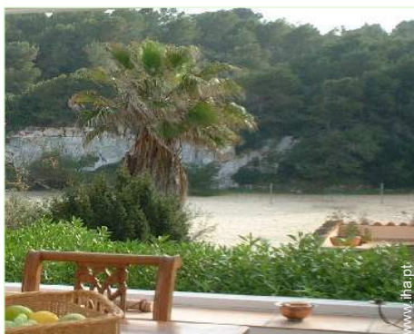
vista a partir da varanda