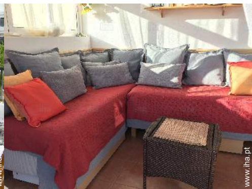
Dormida - cama(s)