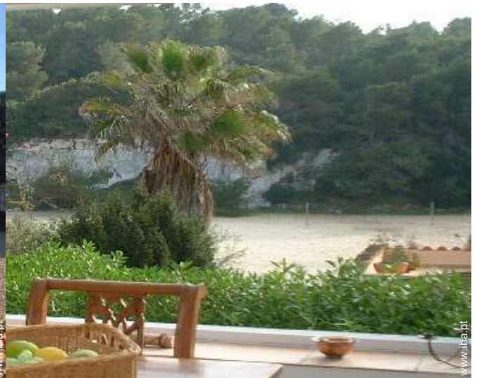
vista a partir da varanda