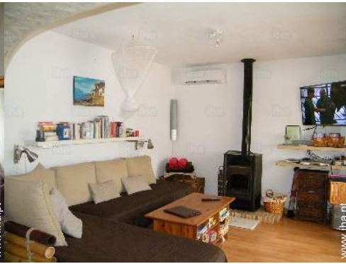
sala de estar