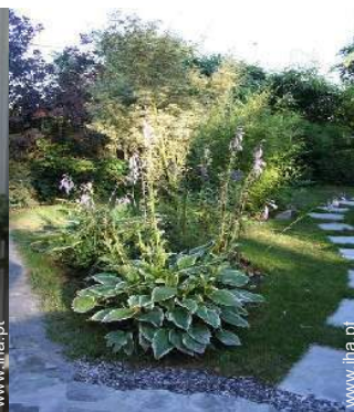
vista da propriedade