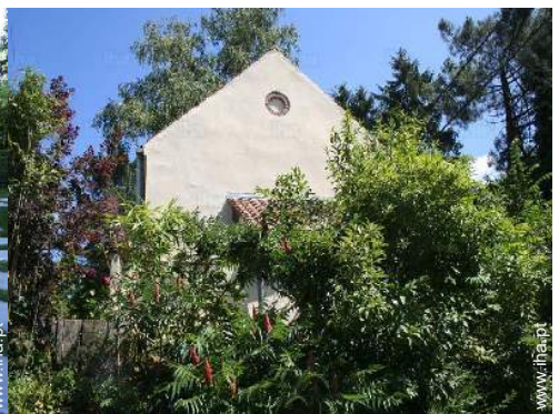
vista da propriedade