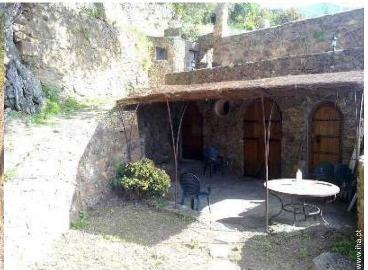
Casa de pedra