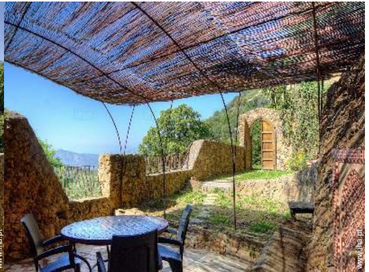
vista a partir do apartamento