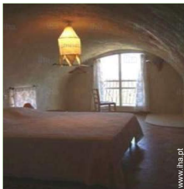
cama(s) de casal