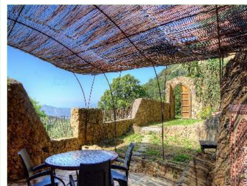
vista a partir do apartamento