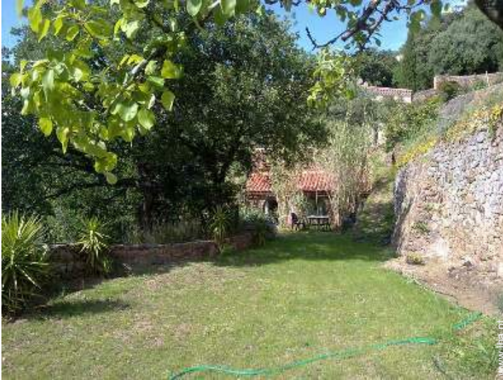
vista a partir do jardim/parque