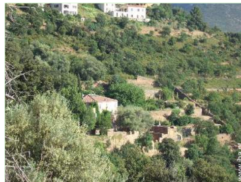
vista da propriedade