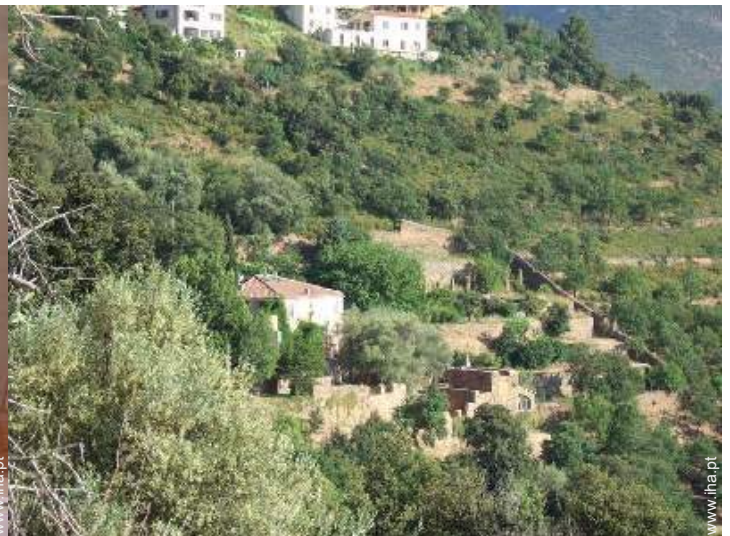
vista da propriedade