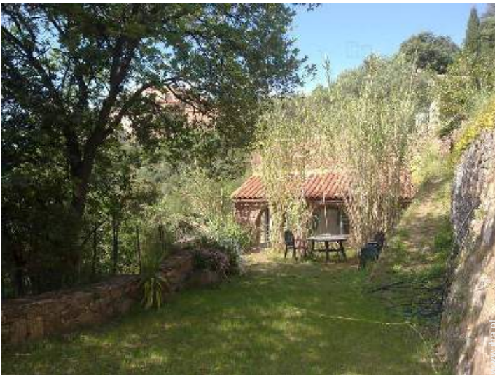
vista a partir do jardim/parque