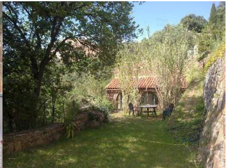
vista a partir do jardim/parque