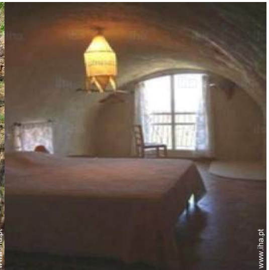
cama(s) de casal