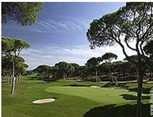
campo de golfe 18 buracos