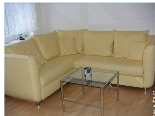
vista a partir da sala de estar

Centro aldeia Paragem/estação de autocarros 200m Aluguer bicicletas/BTT 3km Aluguer de veículos Aluguer roupa/lavandaria 3km Padaria 100m Pequenos comércios 200m Supermercado 3km Cabeleireiro 300m Correios Banco 3km Caixa automático multibanco 2,5km Farmácia 5km Médico 3km Hospital 5km Posto de saúde 5km