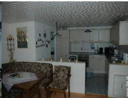
vista a partir da cozinha