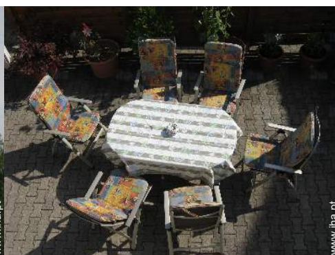
vista a partir do terraço