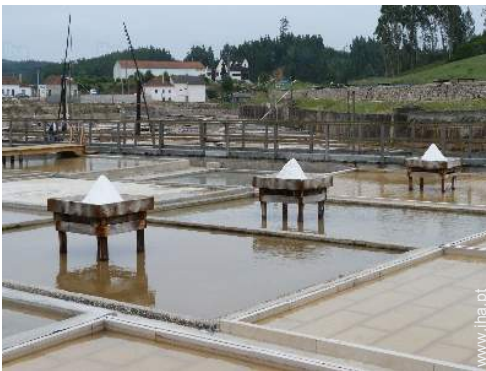
actividades nas proximidades