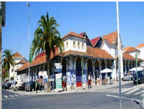
centro da cidade