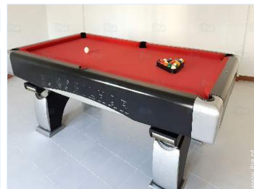
mesa de bilhar