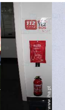
tratamento de roupas