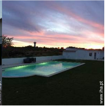
visão de conjunto