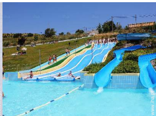
actividades nas proximidades