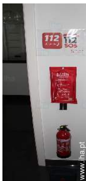
tratamento de roupas