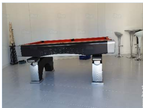
Equipamentos de lazer