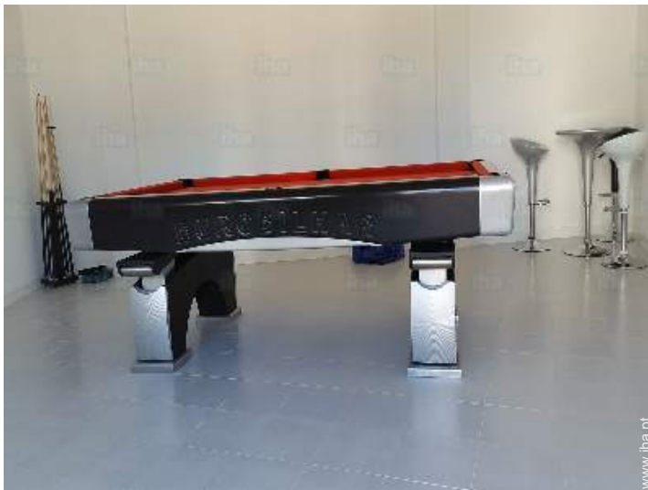
Equipamentos de lazer