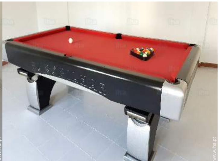
mesa de bilhar