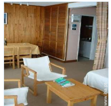
sala de estar