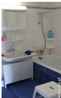
casa(s) de banho