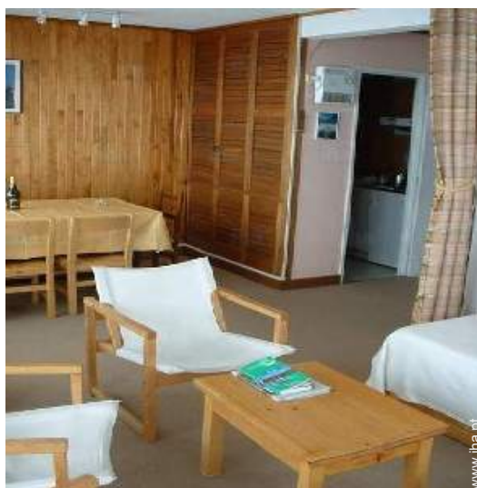
sala de estar