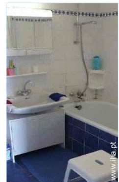
casa(s) de banho

Centro aldeia 100m Aluguer de equipamento de esqui 100m Padaria 100m Comida para fora 100m Supermercado 100m Banco 100m