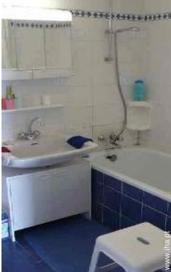
casa(s) de banho