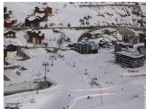
visão de conjunto