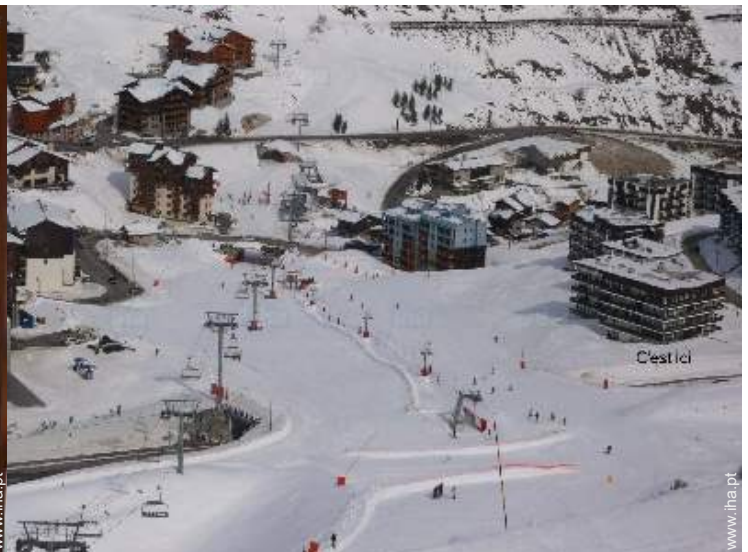
visão de conjunto