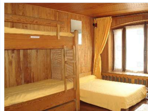
Dormida - cama(s)