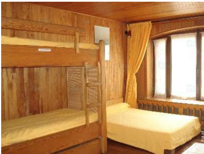
Dormida - cama(s)