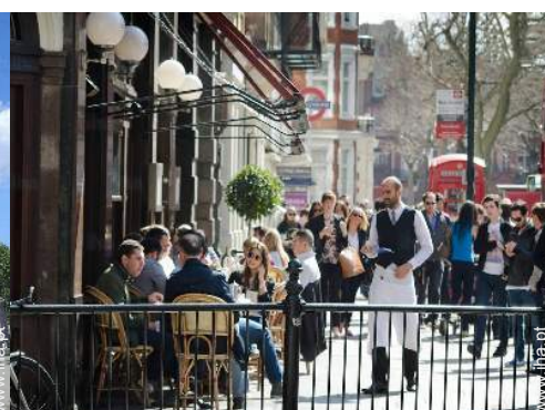
Atracções e lazer