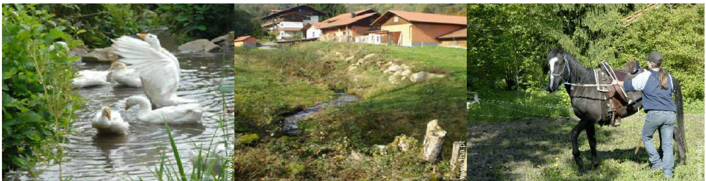
Os animais da casa