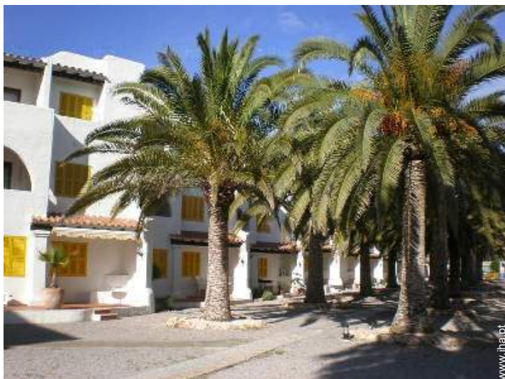
vista a partir do jardim/parque