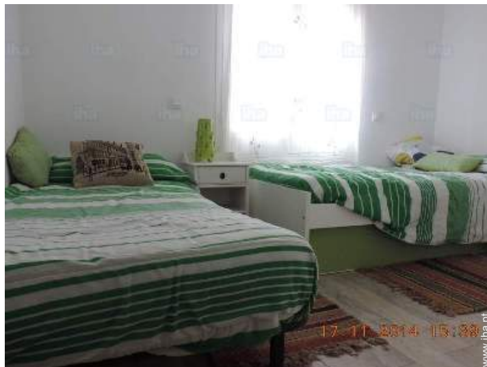
Dormida - cama(s)