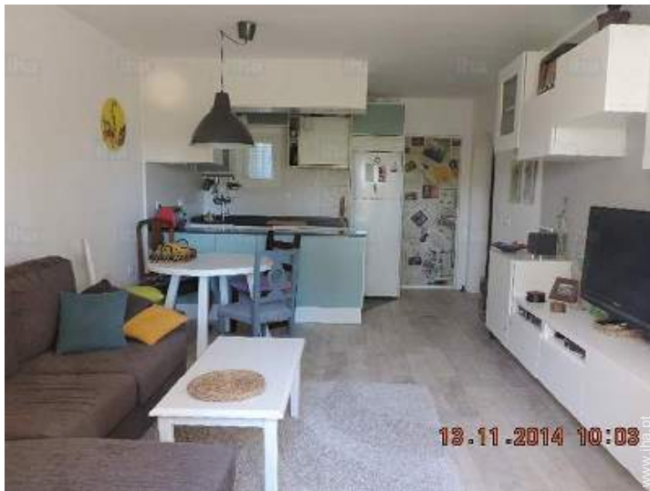
Divisões e comodidades