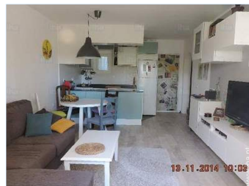
Divisões e comodidades

Bar exterior, mesa(s) de jardim, cadeira(s) de jardim, caramanchão, guarda-sol, salão de jardim, espreguiçadeira(s), cadeira(s) de praia, cama de rede, balancela, baloiço, baloiço para criança, parque infantil com areia, duche exterior