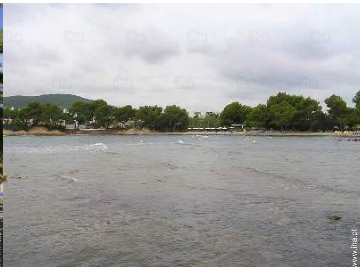
vista de mar