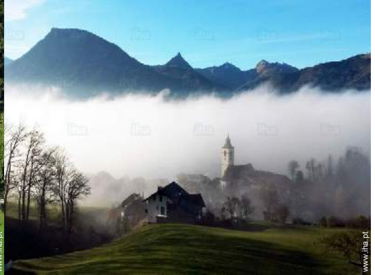
vista a partir da casa