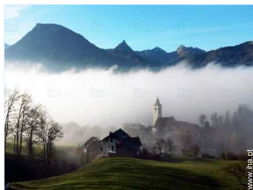
vista a partir da casa

Privilégios : Praia privada, pontão privado