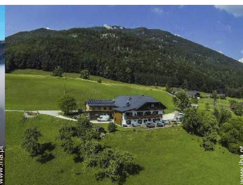
vista a partir da casa