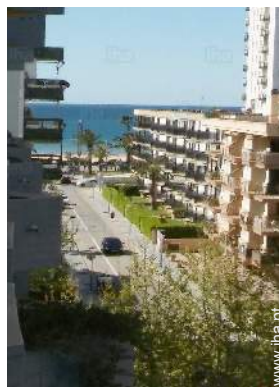
vista a partir do terraço coberto