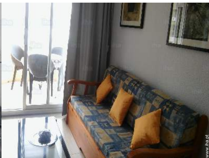
sofá(s) cama 2 pessoas