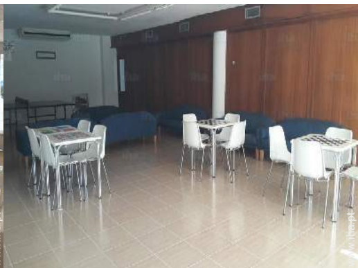
salão de jogos