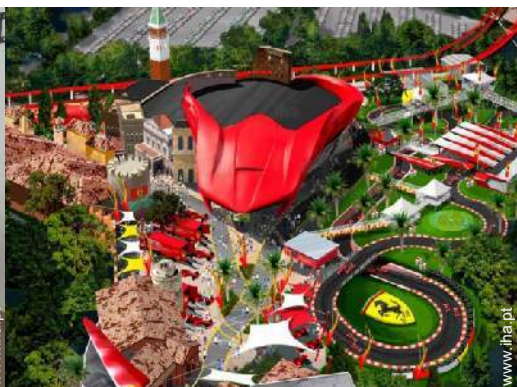
parque de lazer