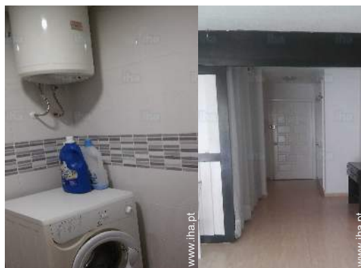
máquina de lavar roupa