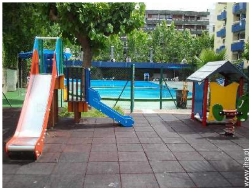
parque de bebé