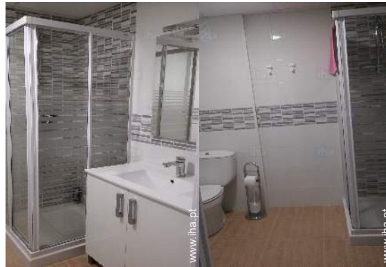
casa(s) de banho