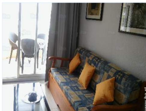
sofá(s) cama 2 pessoas

Louça/talheres, utensílios e trem de cozinha, cafeteira, cafeteira eléctrica, máquina de café expresso, torradeira, espremedor de sumos, placa, micro-ondas, exaustor, frigorífico, congelador, máquina de lavar roupa, ferro de engomar, tábua de passar a ferro