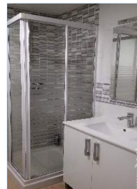
casa(s) de banho

Mesa(s) de jardim, > 30 cadeira(s) de jardim, guarda-sol, salão de jardim, > 30 cadeira(s) de praia, balancela, baloiço, parque infantil com areia, duche exterior