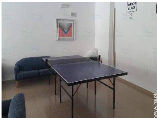
salão de jogos