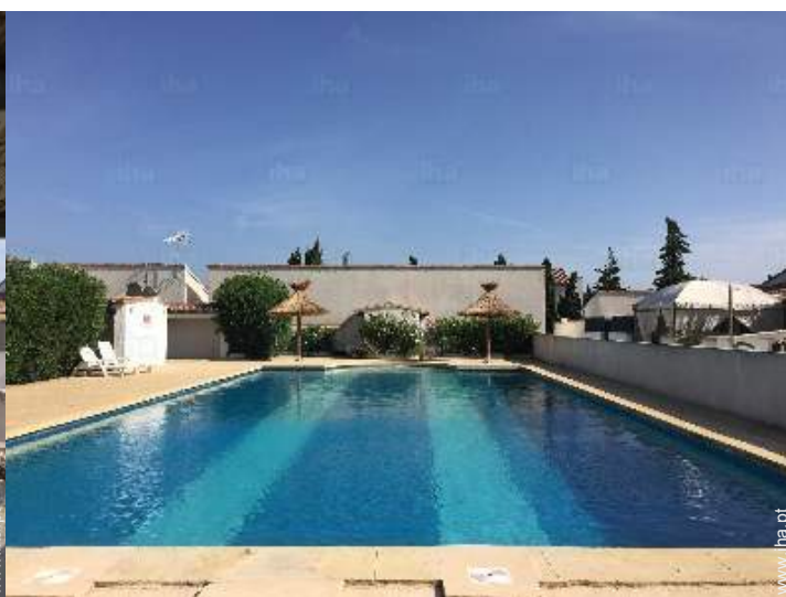
vista a partir do terraço