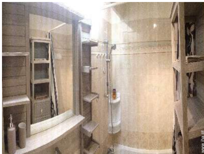
casa(s) de banho