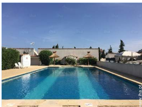
vista a partir do terraço