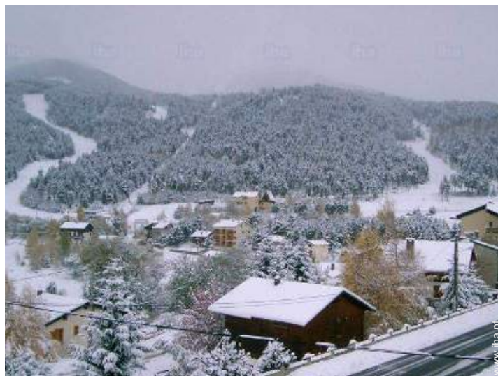
vista a partir da sala de estar