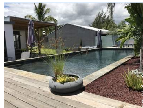
vista a partir da piscina

Centro aldeia 800m Aluguer bicicletas/BTT 1km Aluguer de moto/scooter 1,5km Aluguer de veículos 2km Aluguer de barco 2km Aluguer de material de mergulho 2km Padaria 1km Comida para fora 1km Pequenos comércioos 800m Supermercado 1,5km Cabeleireiro 1km Correios 1,5km Banco 800m Caixa automático multibanco 800m Farmácia 1km Médico 1km Enfermeira 1km Hospital 10km