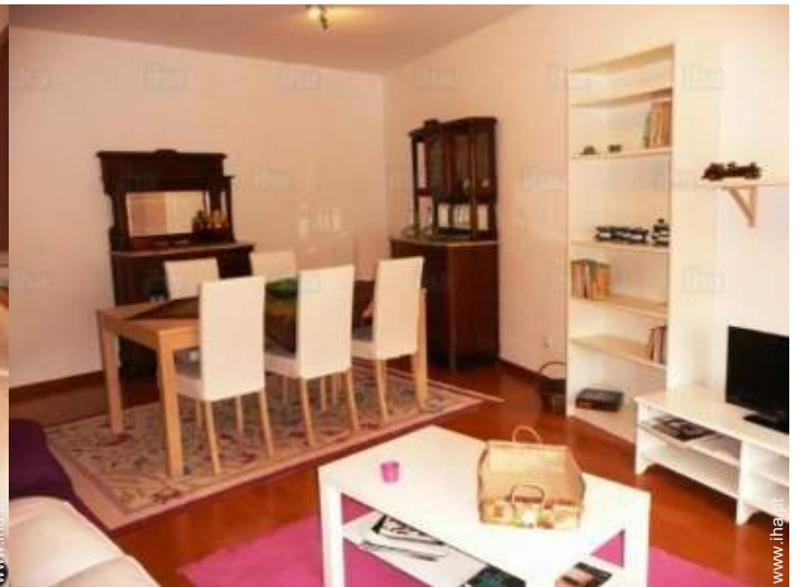
sala de jantar