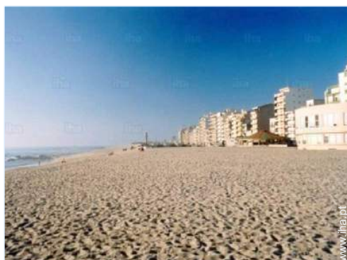
actividades balneares nas proximidades

Estacionamento coberto : 1 individual/ais fechado(s). Estacionamento ar-livre