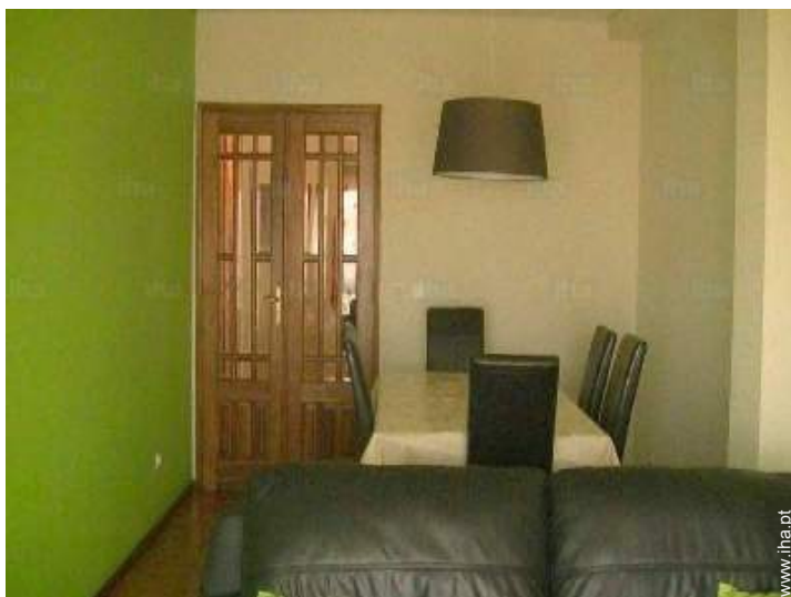
sala de jantar