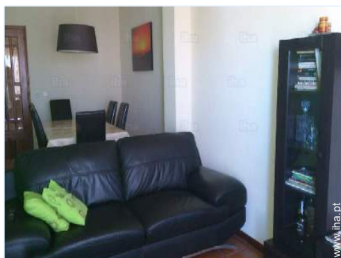
sala de jantar