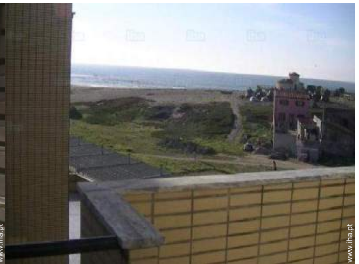
vista a partir da casa