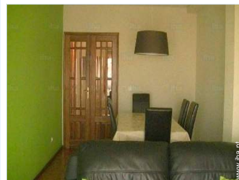
sala de jantar