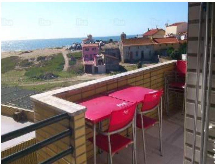
vista a partir da casa