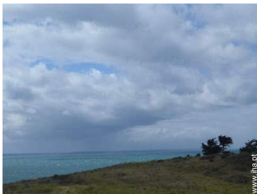
vista a partir do terraço