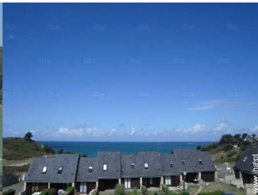
vista a partir do quarto