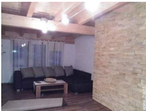
sala de estar