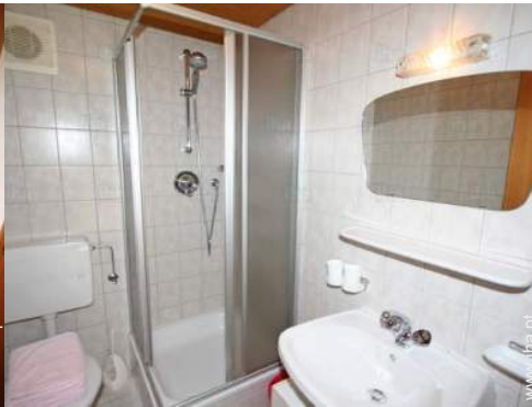
casa(s) de banho