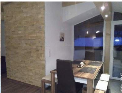
sala de estar