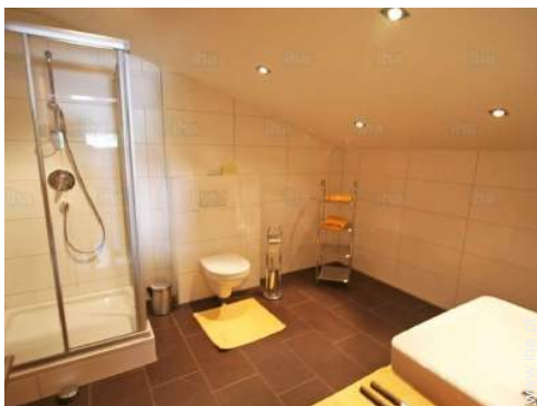
casa(s) de banho