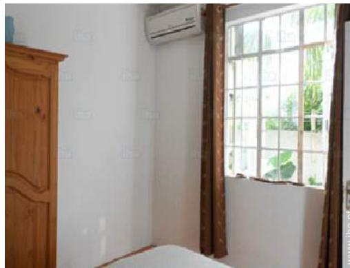
quarto de amigos