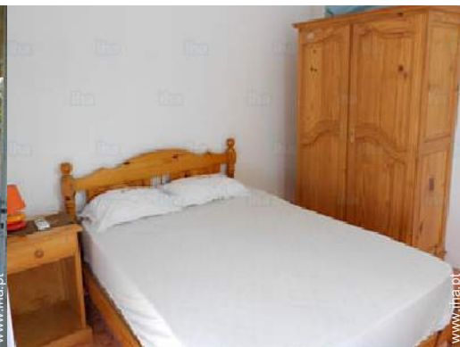
quarto de amigos