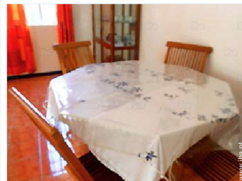
sala de jantar