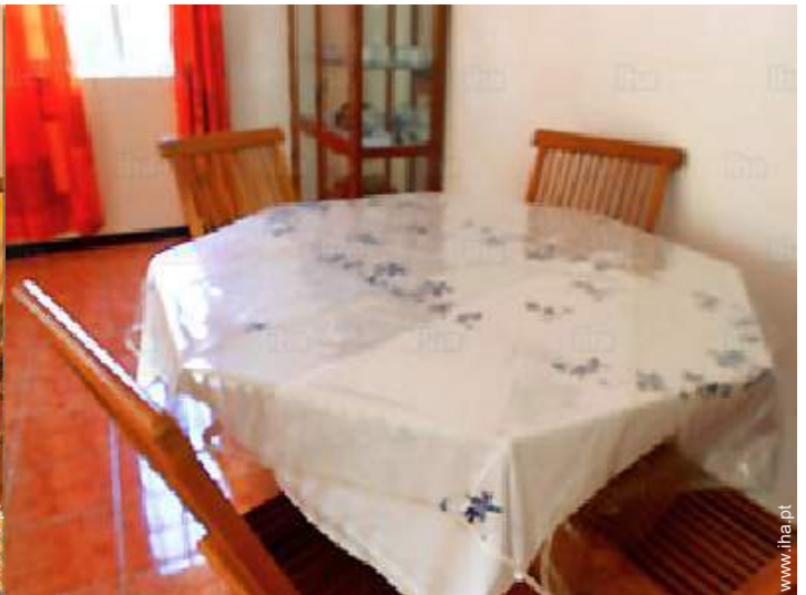
sala de jantar