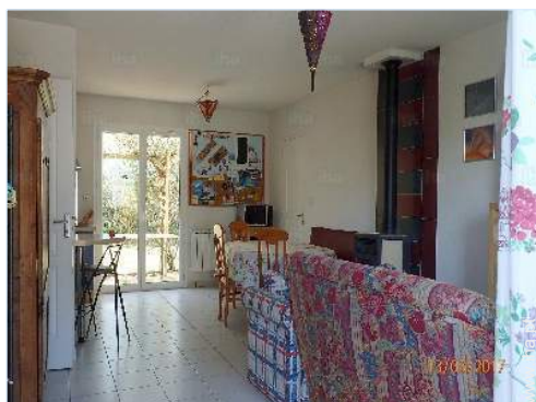
sala de estar