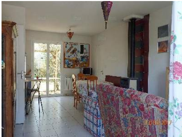
sala de estar