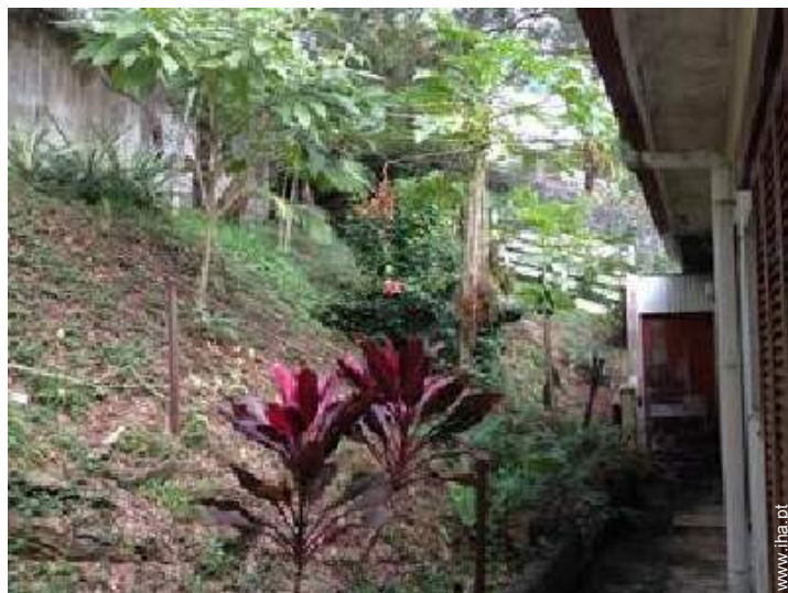
vista a partir do quarto