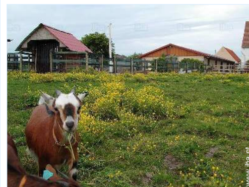
animais da quinta