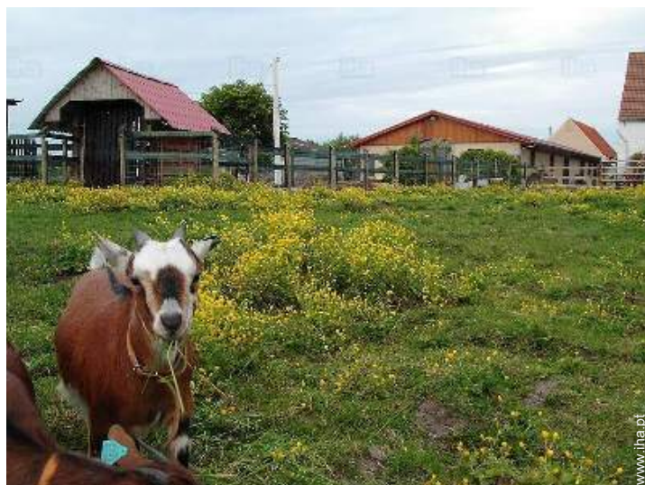
animais da quinta