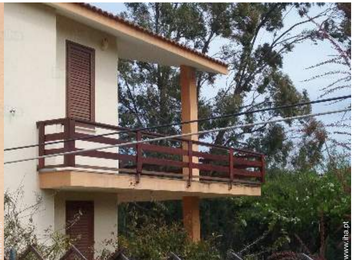
vista da propriedade