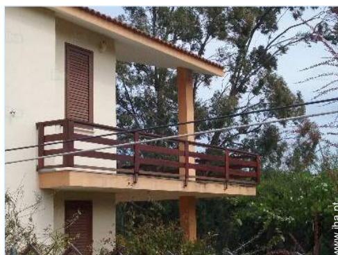
vista da propriedade