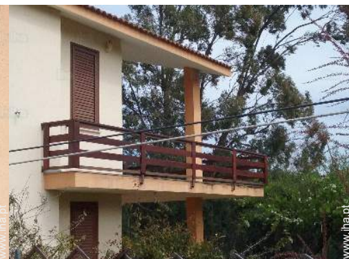
vista da propriedade