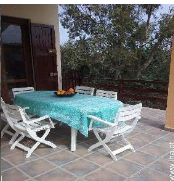
vista a partir do terraço coberto