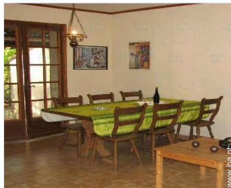
sala de jantar