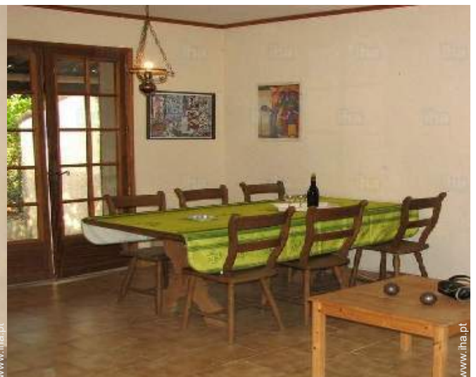
sala de jantar