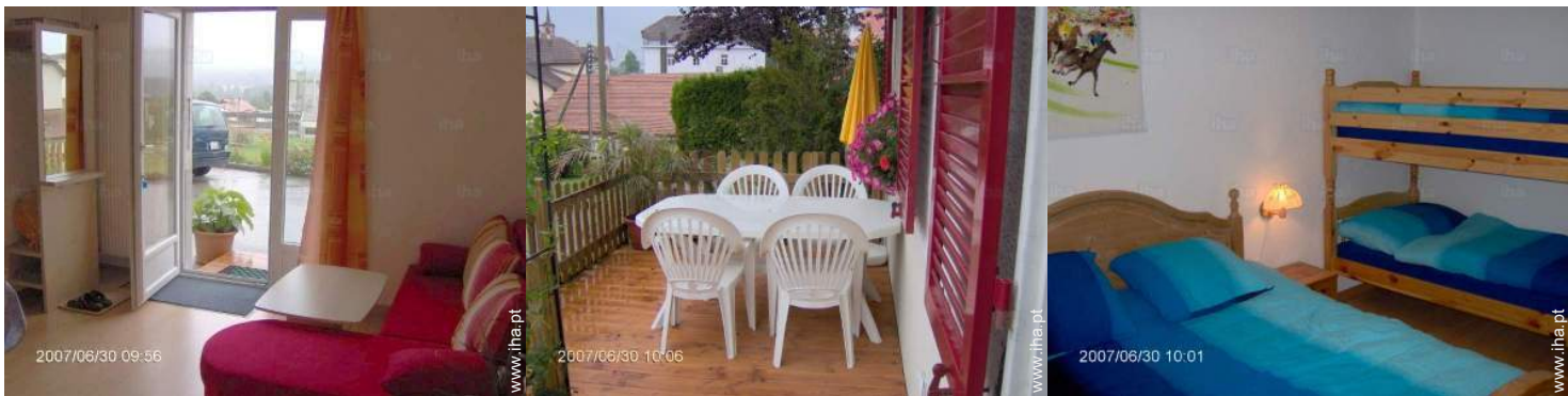
vista a partir da sala de estar