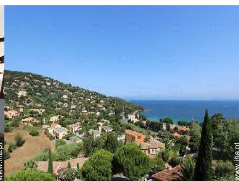
vista a partir do terraço