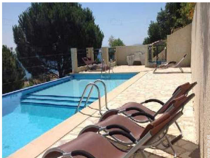
vista a partir da piscina