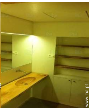
casa(s) de banho