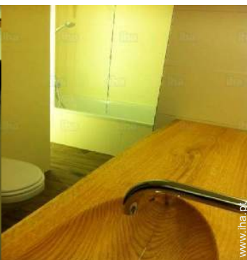
casa(s) de banho