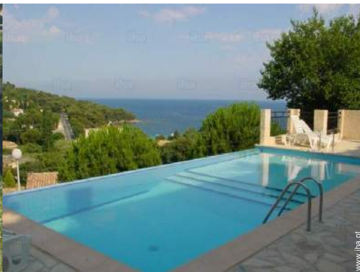
vista a partir da piscina