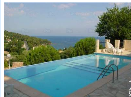
vista a partir da piscina