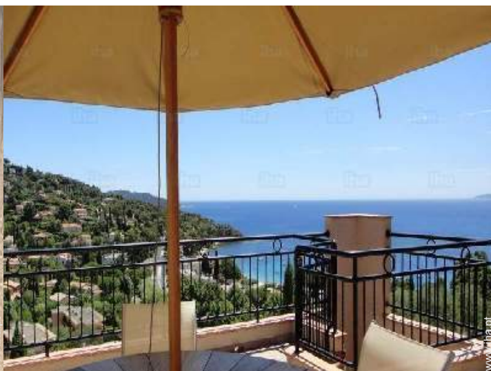
vista a partir do terraço