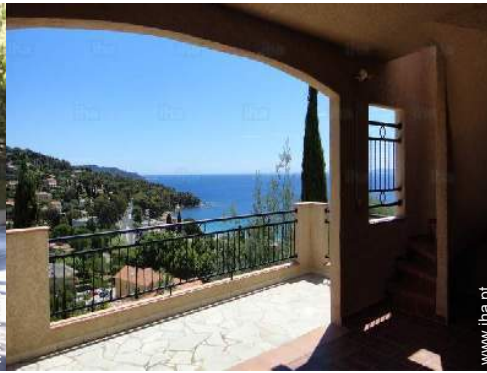
vista a partir do quarto