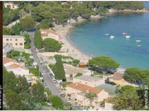
vista a partir da casa