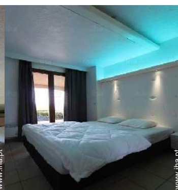
Dormida - cama(s)