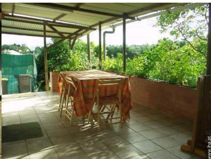
vista a partir do terraço coberto