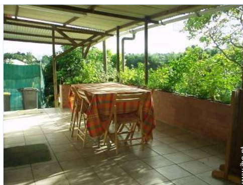
vista a partir do terraço coberto