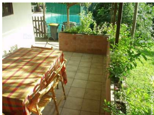
vista a partir do terraço coberto