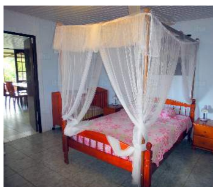
Dormida - cama(s)