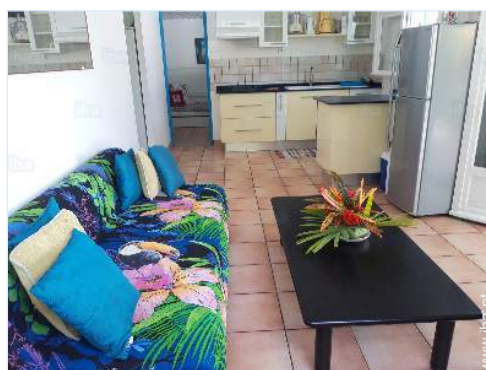
vista a partir do salão

Louça/talheres, utensílios e trem de cozinha, cafeteira, torradeira, grelhador, placa, forno, micro-ondas, frigorífico, máquina de lavar roupa, ferro de engomar, tábua de passar a ferro