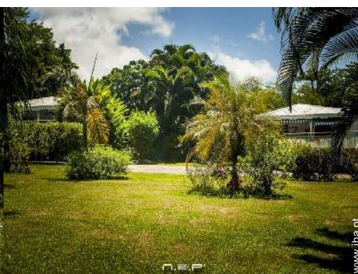
vista a partir do jardim/parque