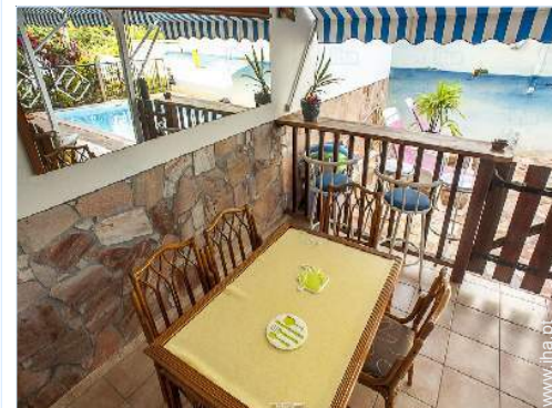
vista a partir do quarto