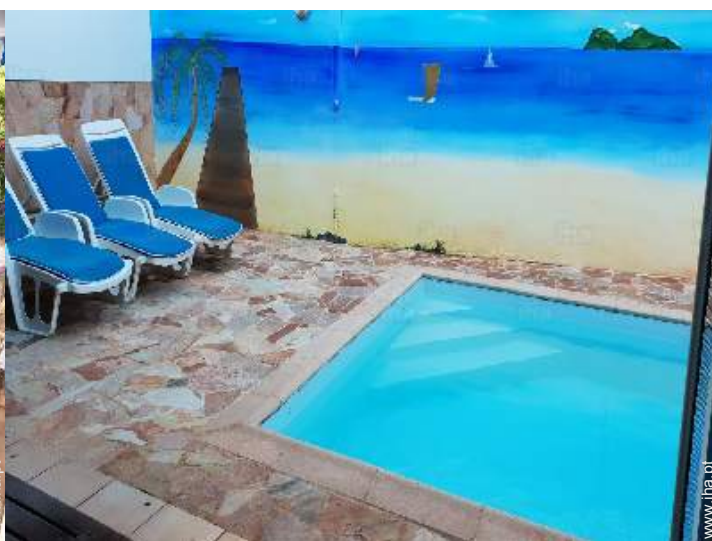
vista a partir do terraço coberto