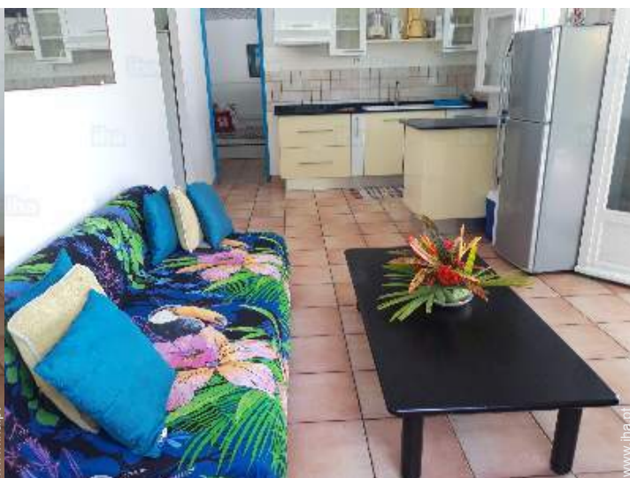
vista a partir do salão