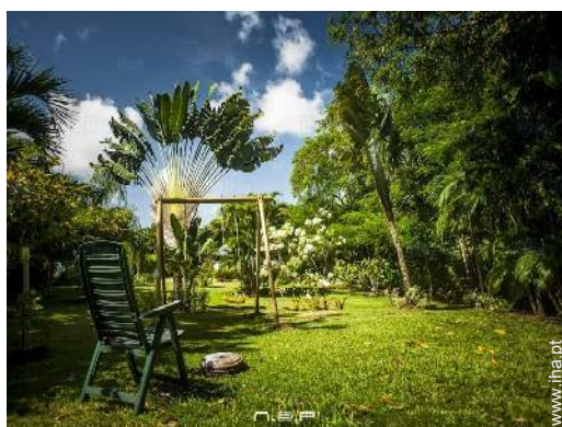
infraestruturas de lazer