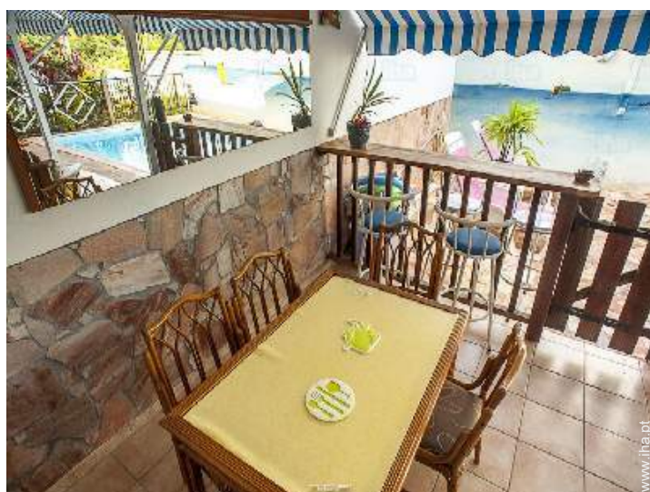
vista a partir do quarto