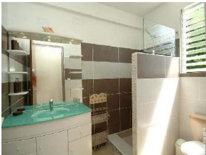
Conforto interior e equipamentos