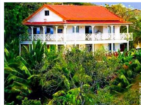
vista da propriedade