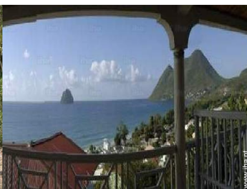
visão de conjunto