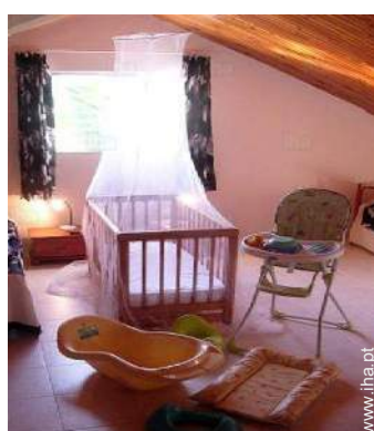
Equipamentos para bebés