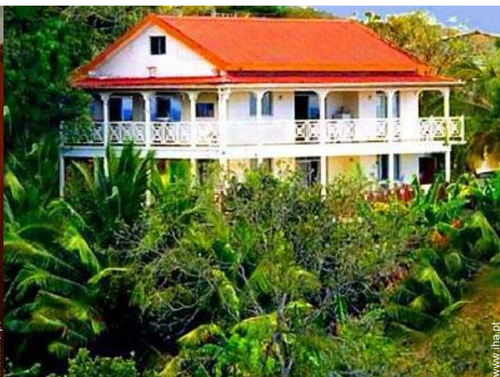
vista da propriedade