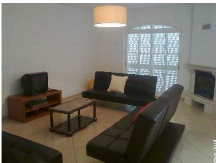
sala de estar