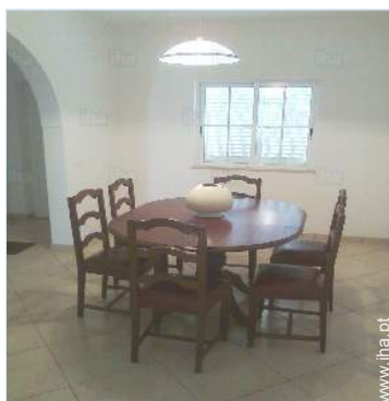
sala de jantar