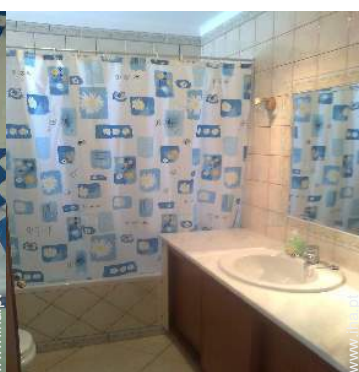
casa(s) de banho