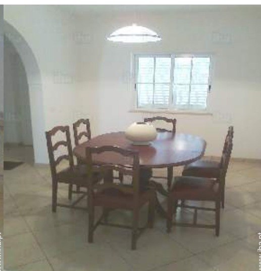
sala de jantar