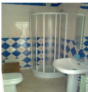
casa(s) de banho