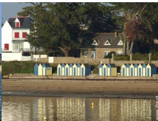
acesso directo à praia