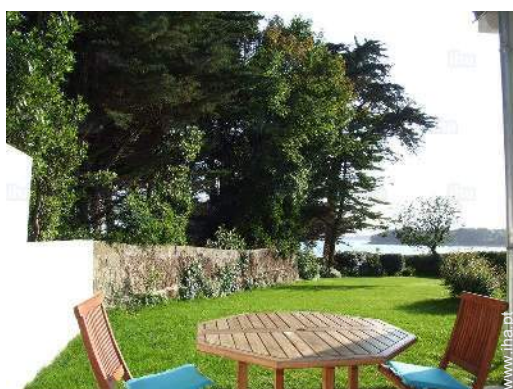
vista a partir do quarto