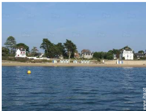
acesso directo à praia