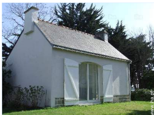
Ambiente exterior à disposição dos hóspedes