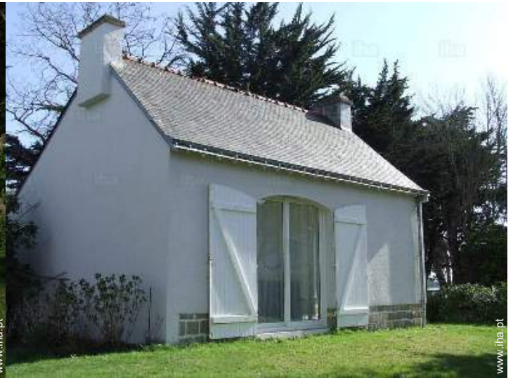
Ambiente exterior à disposição dos hóspedes