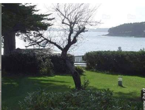
vista a partir do salão