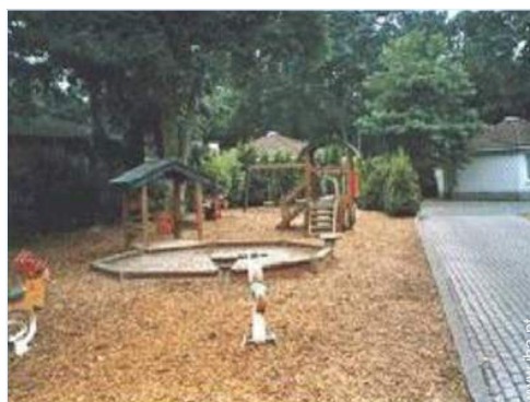
Equipamentos de lazer