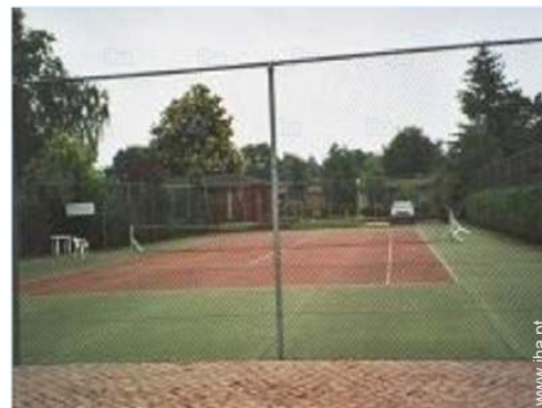
ténis na residência