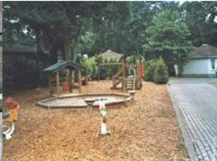
Equipamentos de lazer